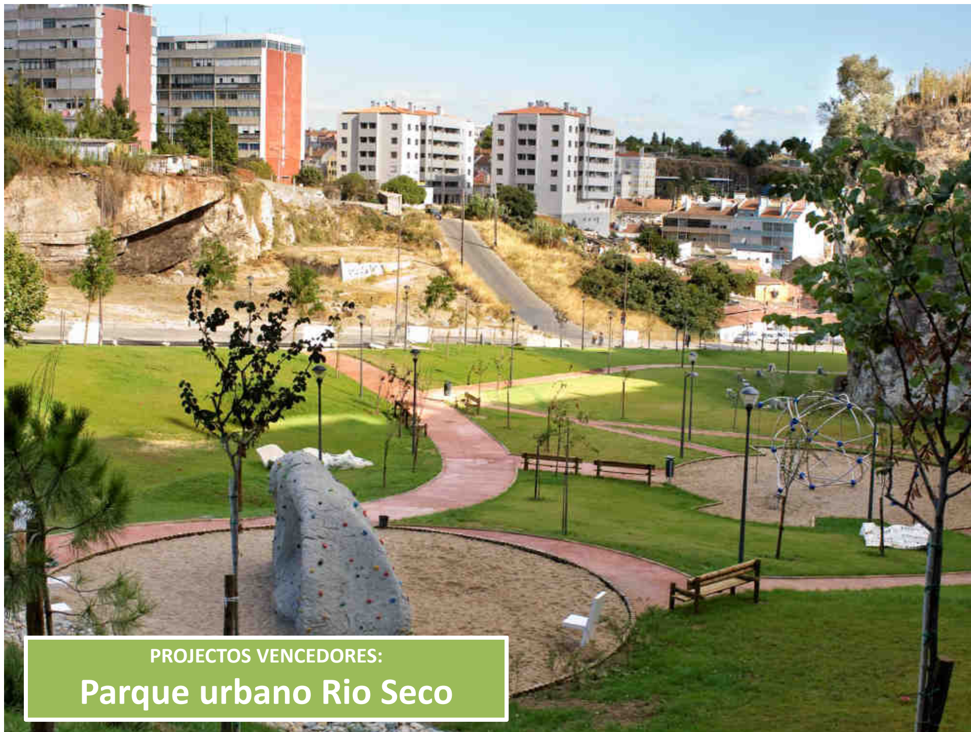
PROYECTOS VENCEDORES: Parque urbano Rio Seco