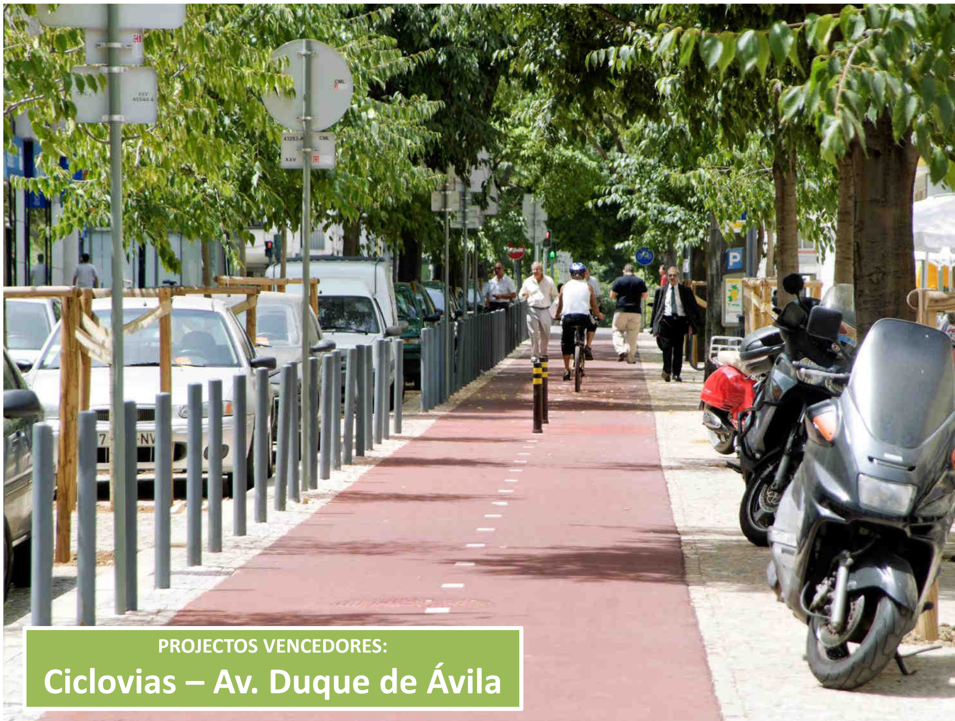
PROYECTOS VENCEDORES: Ciclovías – Av. Duque de Ávila