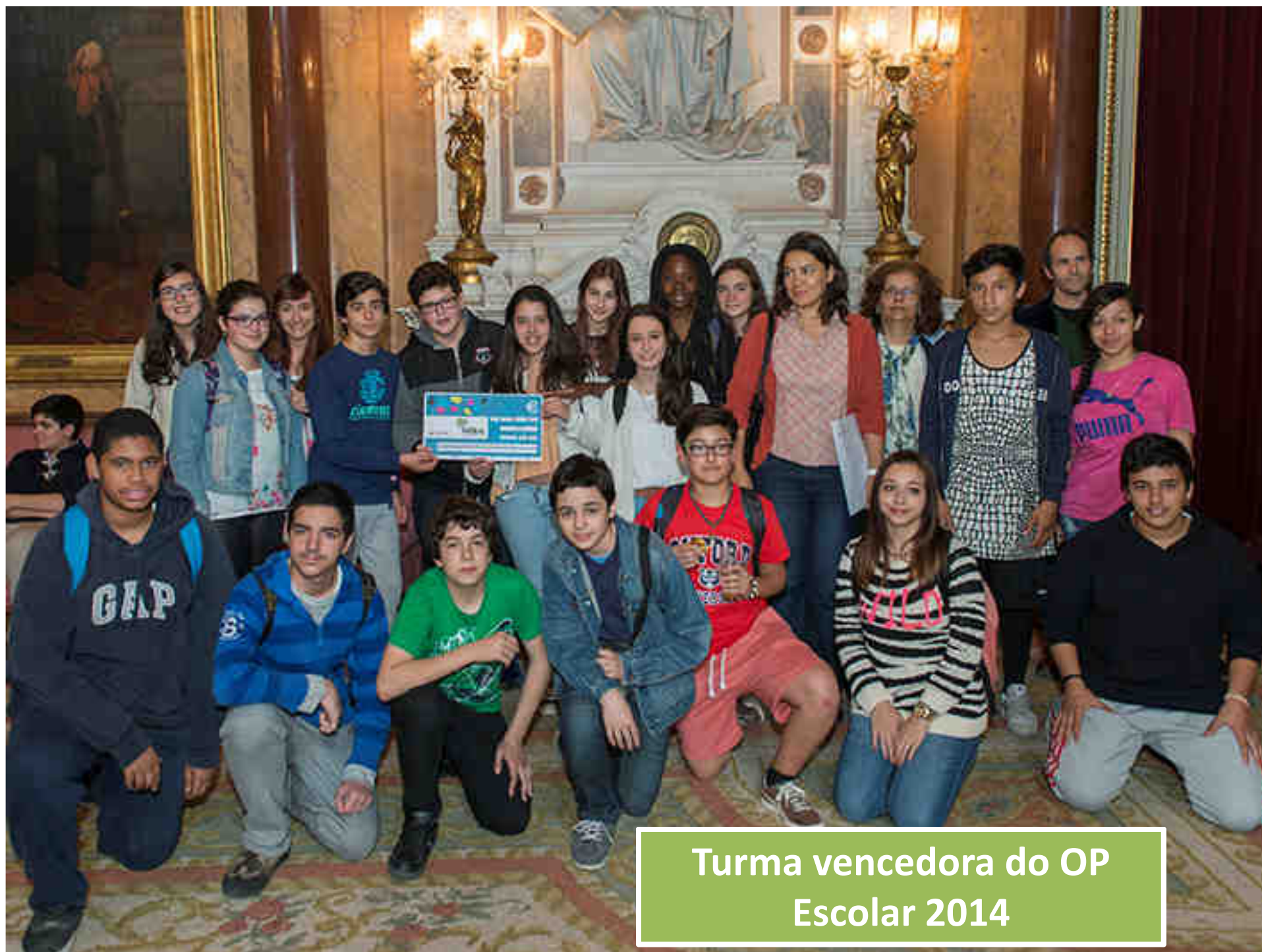
Turma vencedora do OP Escolar 2014