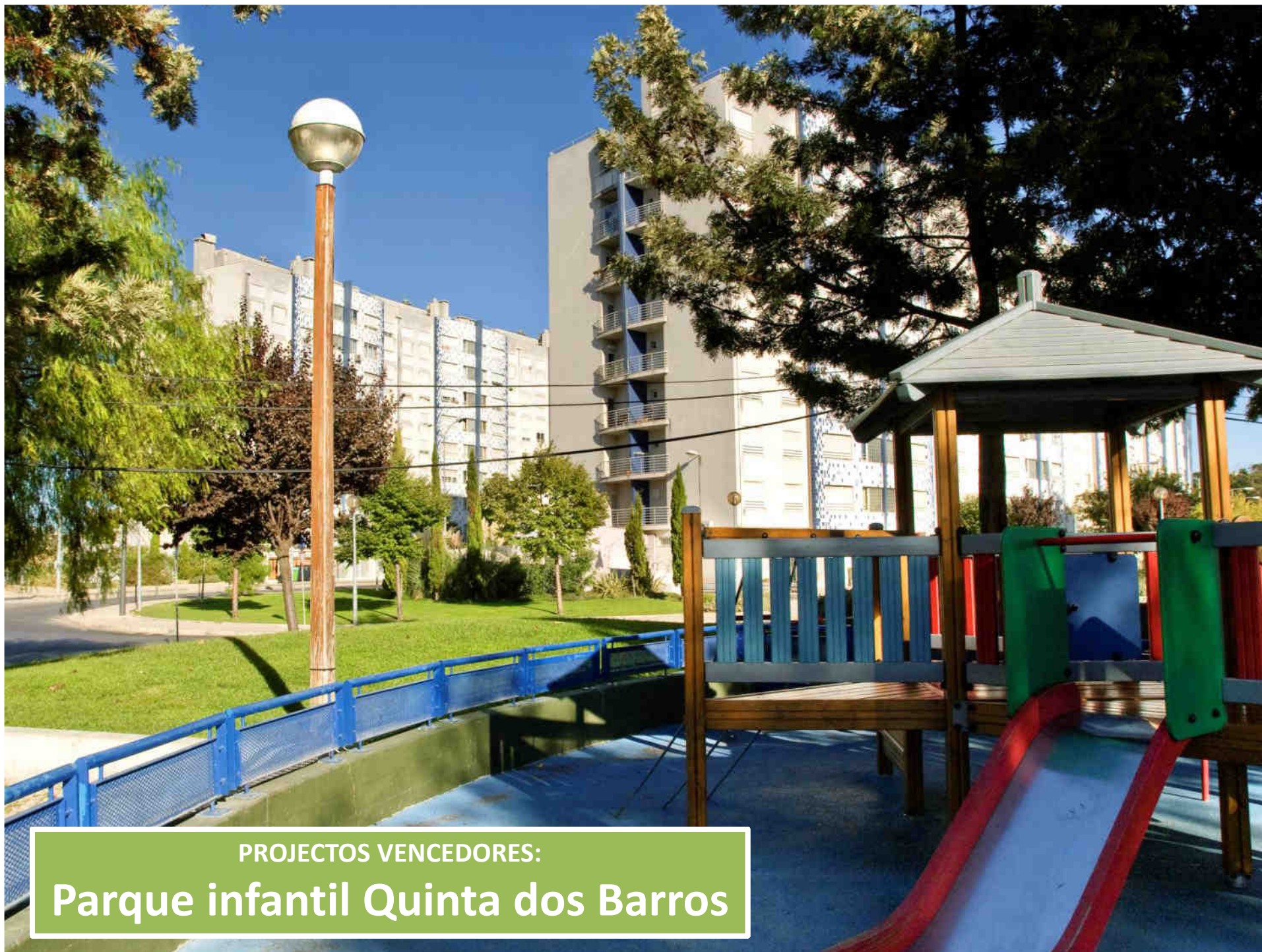
PROJECTOS VENCEDORES: Parque infantil Quinta dos Barros