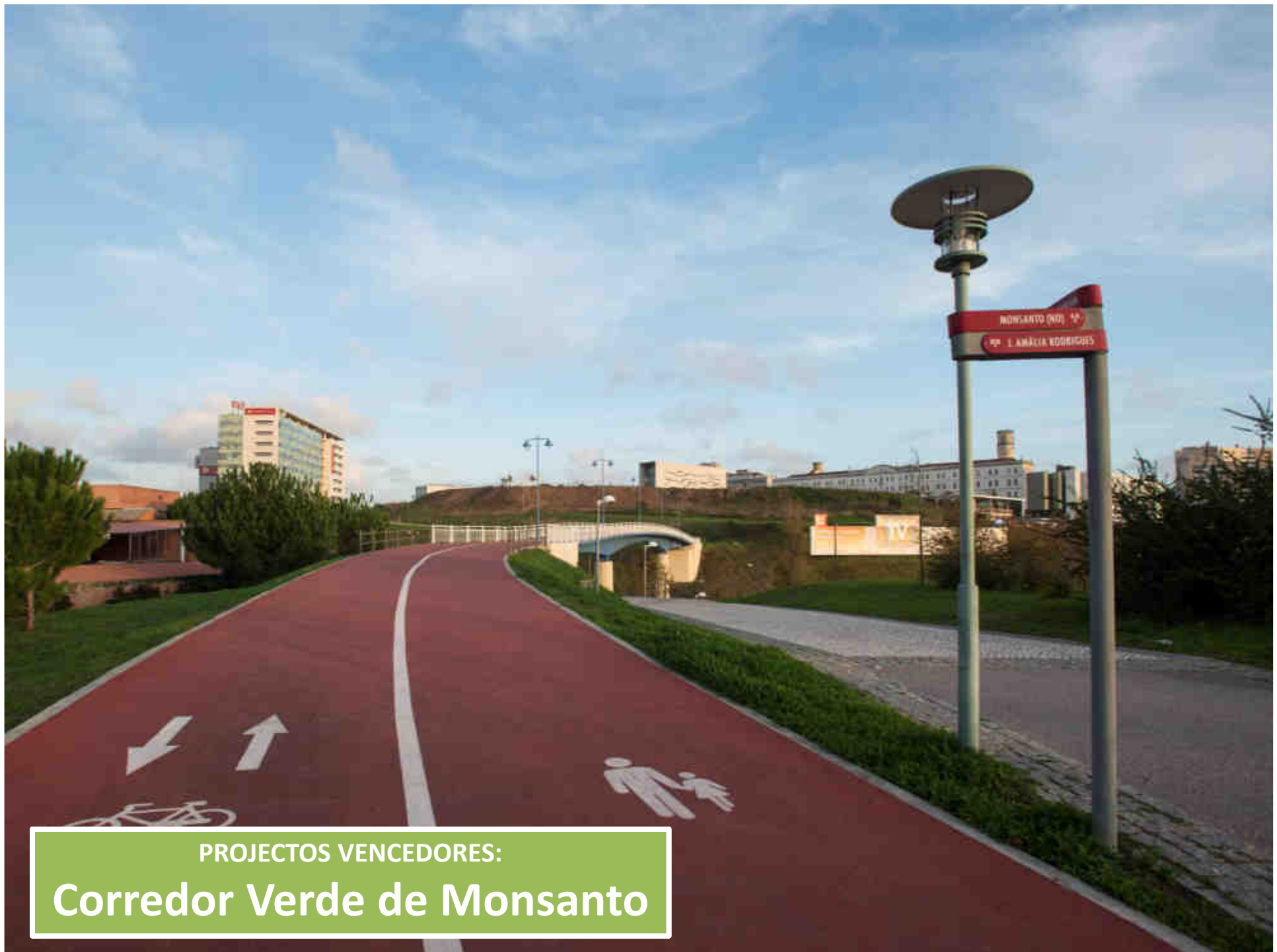
PROYECTOS VENCEDORES: Corredor Verde de Monsanto