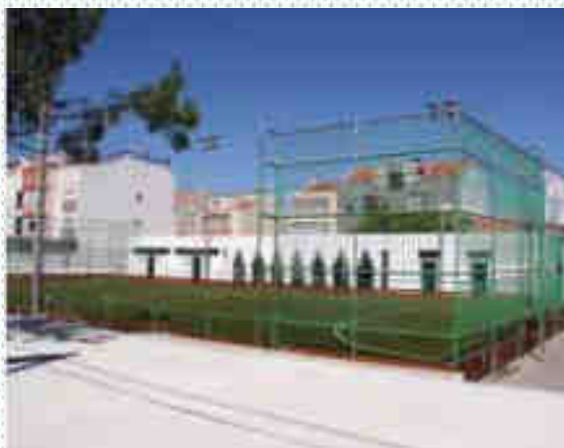
Polidesportivo Manuel Guerra