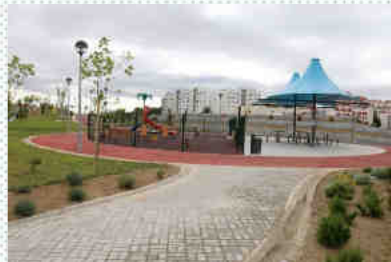
Matinha da Venda Nova