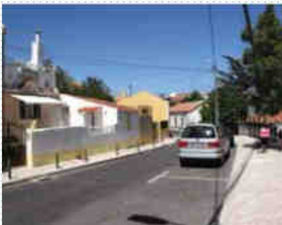
Rua Fernando Maia em A-da-Beja

Elaboração do projeto e execução das obras de requalificação - 179.050,10€