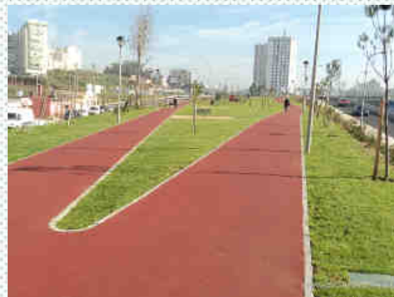
Pista de Caminhada em Alforneiros

Elaboração do projeto e execução das obras de implantação da pista entre o centro de saúde e a Praça Teófilo Braga - 83.918,85€